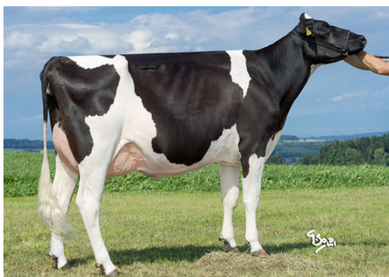
CASTEL MOGUL TALINI