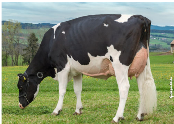
CASTEL MOGUL TALINI