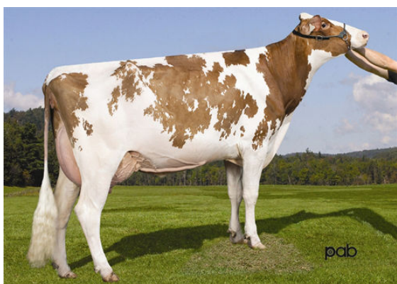
VIDIA MR BURNS MISS