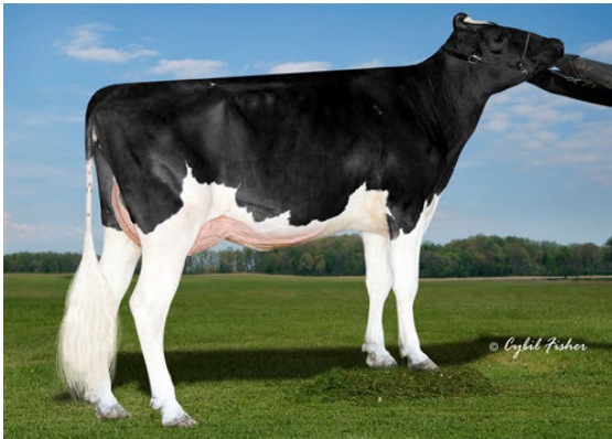
SHELAND REFLECTOR BRIGHT FOURTH DAM