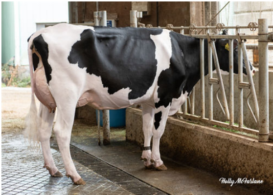
COOKIECUTTER FANCA HOCCO DAM