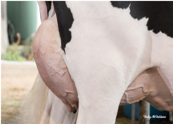
COOKIECUTTER FANCA HOCCO DAM