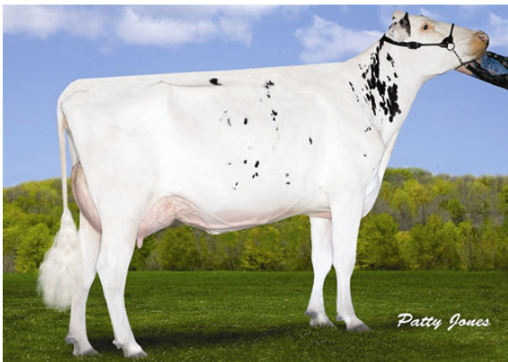
VELTHUIS S G SNOW EVENING FIFTH DAM