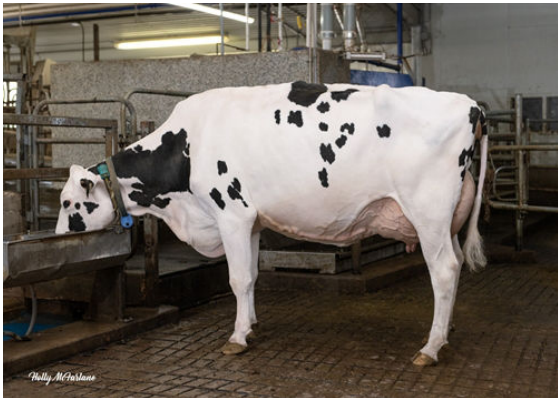
FLEURY SALVATORE ECLAIR GRANDDAM