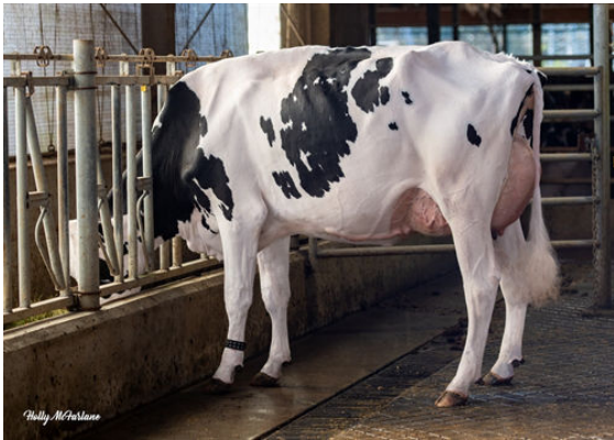
PROGENESIS FORTNITE REDEEM DAM