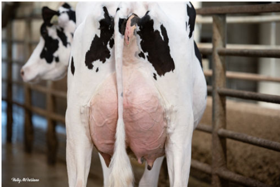
PROGENESIS FORTNITE REDEEM DAM