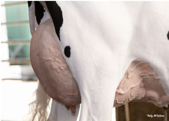
PROGENESIS ZAZZLE RINGSIDE DAM