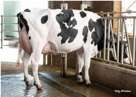
PROGENESIS ZAZZLE RINGSIDE DAM