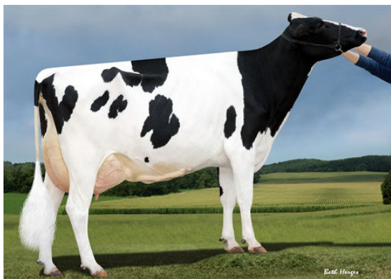
SANDY-VALLEY MORGAN CALVARY FOURTH DAM