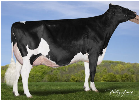
SILVERRIDGE V DUKE EMAIL GRANDDAM