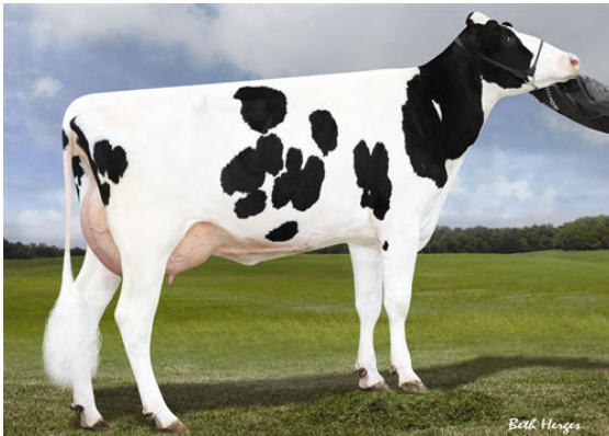
MISS OCD ROBST DELICIOUS FOURTH DAM