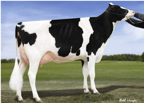
MORSAN MAN D MISSY FIFTH DAM