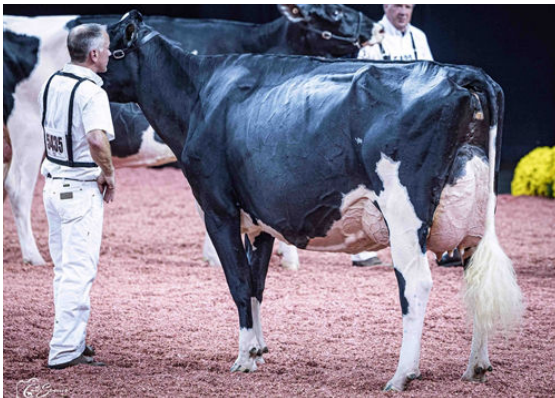
RJR DISCJOCKEY 7509 DAUGHTER