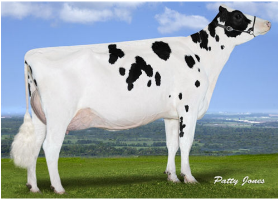
EDG DAHLIA MOGUL 2257