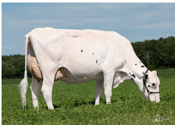
MICHERET VIAGRA SUMMERDAY DAUGHTER