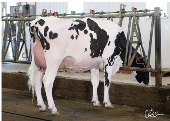
MICHERET VIARAIL SUMMERDAY DAUGHTER