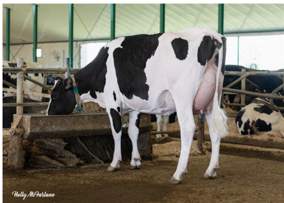
ROOSBURG SUMMERDAY COOL SHADE DAUGHTER