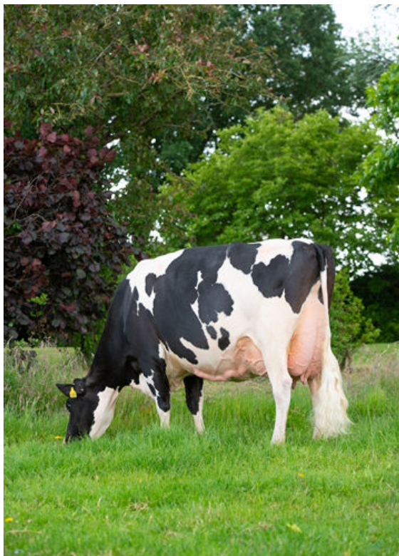
DE OOSTERHOF DG ROSE D DAM