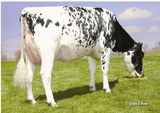
LARCREST COSMOPOLITAN FOURTH DAM