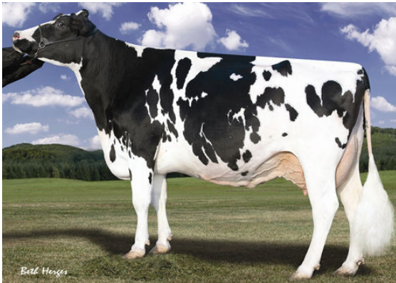
LARCREST OSIDE CHAMPAGNE-TW FIFTH DAM