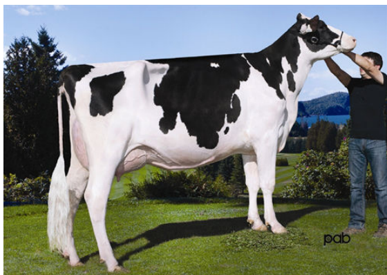
STE ODILE MANOMAN MOD PLATINE