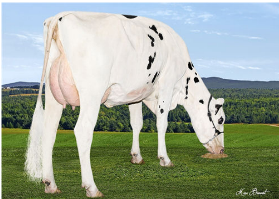
CHAMLAB RUMBA AIRINTAKE