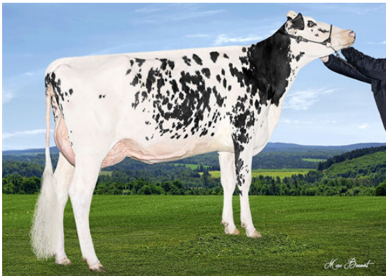
DESDEUXLACS BETUNIA AIRINTAKE