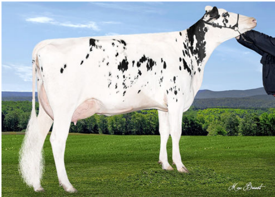
MASKITA AIRINTAKE TAMPOURA