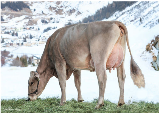
ULLA SG DAUGHTER