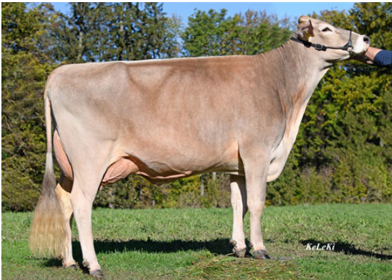
JOLAHOFS BARCA DONATELLA DAUGHTER