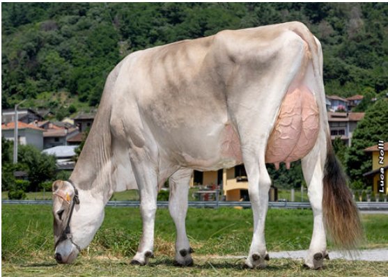
BARCA URALI DAUGHTER