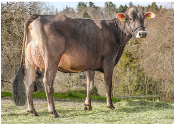
ZGRAGGEN BS AMIR AMSEL DAUGHTER