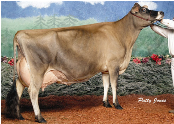
JIF LITTLE MINNIE FIFTH DAM