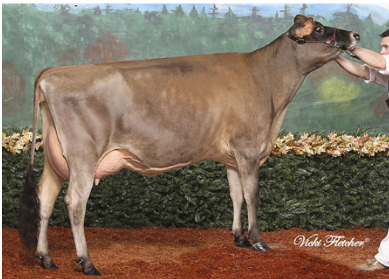
SELECT -SCOTT SALTY COCOCHANNEL THIRD DAM