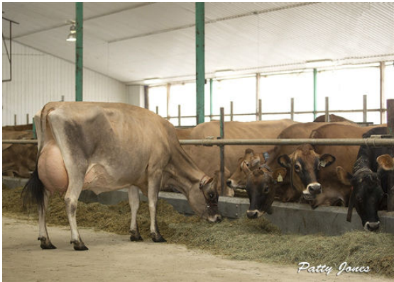
LENCREST COCOPUFF DAM