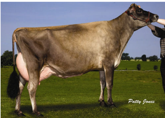
HAUPTRE SULTAN FAME