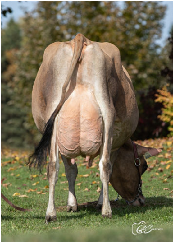
LENCREST PREMIER FARREN