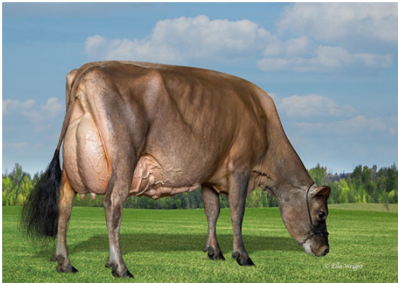
SUNNY HILL NOTEPAD ARMADILLO DAM