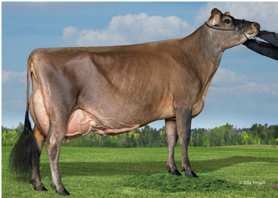
SUNNY HILL NOTEPAD ARMADILLO DAM