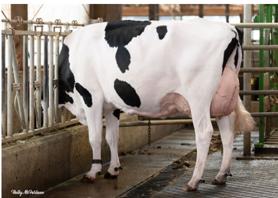
PROGENESIS ZAZZLE PRACTICE GRANDDAM