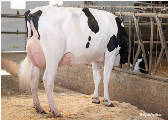
PROGENESIS JALAPENO PEPPY DAM