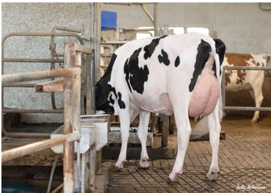
PROGENESIS JALAPENO PEPPY DAM