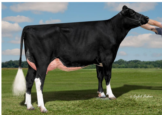
AOT PERFECT HONNA DAM