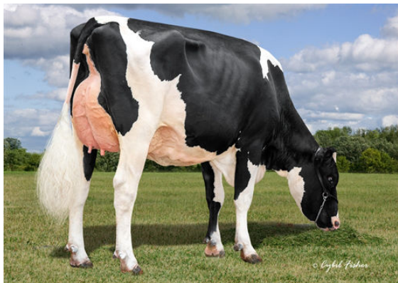
AOT POSITIVE HALLMARK GRANDDAM