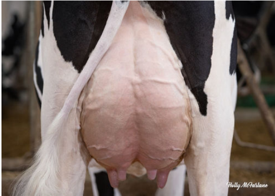
PROGENESIS ROYALFLUSH PAPAYA DAM

GESUNDHEIT UND FRUCHTBARKEIT Immunity 91