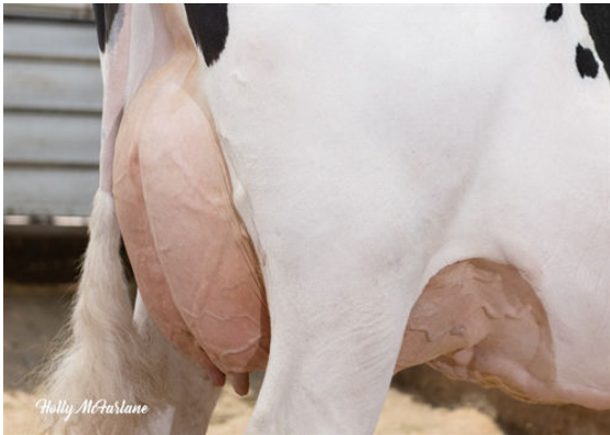
OCD LEGENDARY RAE FOURTH DAM