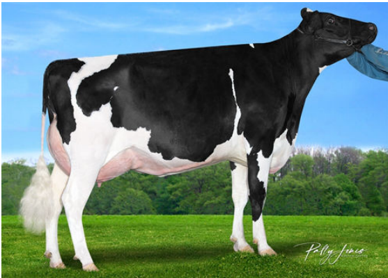
CLAYNOOK ZIVA HOUSE GRANDDAM