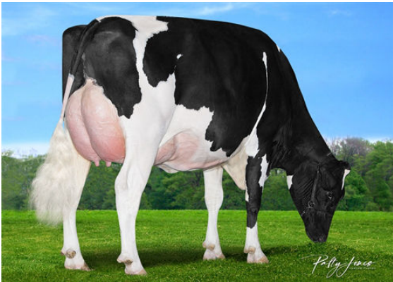
CLAYNOOK ZIVA HOUSE GRANDDAM