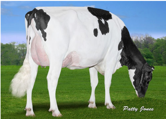
CLAYNOOK FABBY SILVER FOURTH DAM