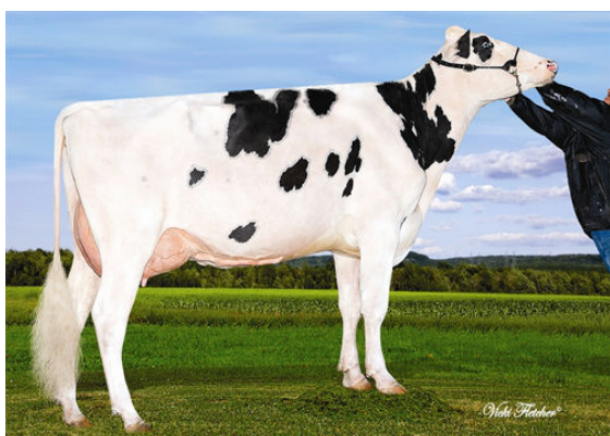
EDG CLAIRE CLING THIRD DAM