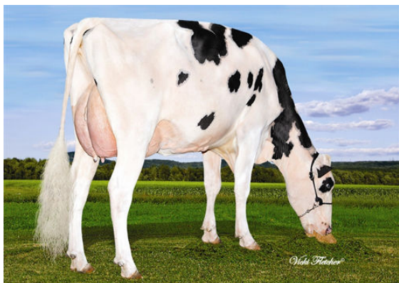
EDG CLAIRE CLING THIRD DAM