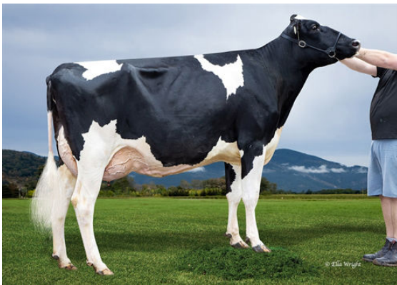
PEAK GUARANTEE NOBLE GRANDDAM