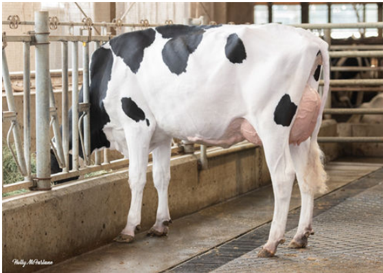
PROGENESIS FELLOWSHIP PUDDLES DAUGHTER