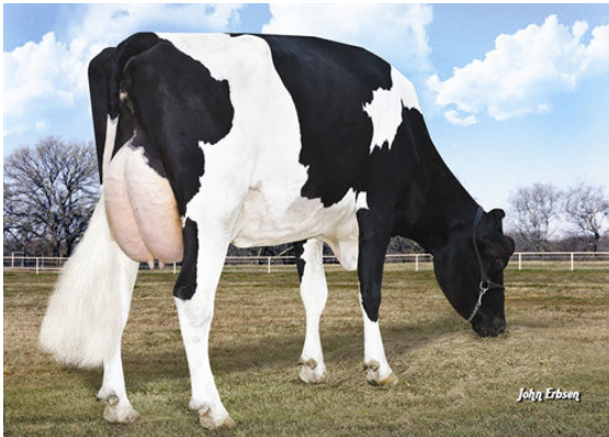
MORNINGVIEW SUPER ROXY