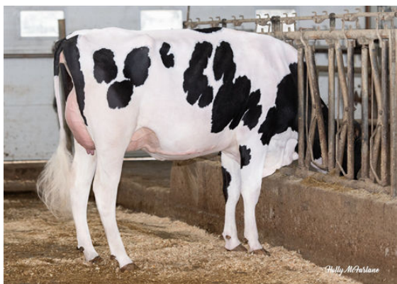
PROGENESIS ROYALFLUSH PAPAYA DAUGHTER