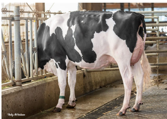
WESTCOAST RYLFLSH NAPPY 13063 DAUGHTER

GESUNDHEIT UND FRUCHTBARKEIT Immunity 101