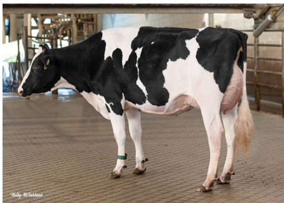
WESTCOAST RYLFLSH NAPPY 13063 DAUGHTER