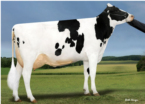
SANDY-VALLEY SLV ESSENCE GRANDDAM