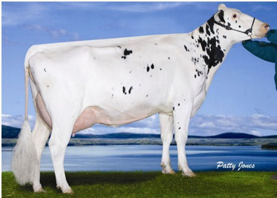
WABASH-WAY EVETT FIFTH DAM