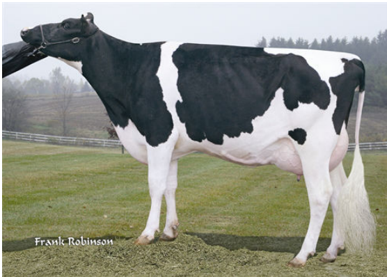
HOL-STAR OUTSIDE TERE FOURTH DAM