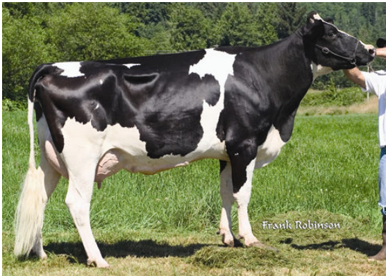
HOL-STAR TEARY DURHAM FIFTH DAM