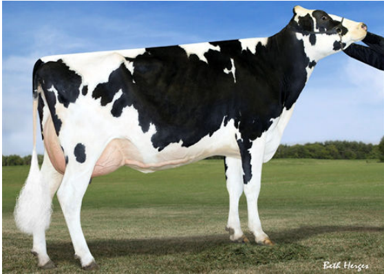
B-ENTERPRISE SUPER GIGI THIRD DAM