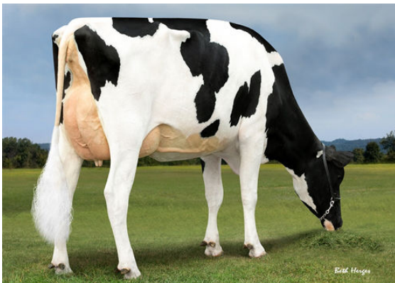
PROGENESIS JEDI HOLOCRON