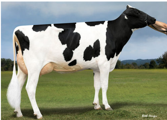
PROGENESIS JEDI HOLOCRON