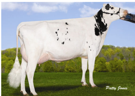
CALBRETT PLANET EVE FOURTH DAM