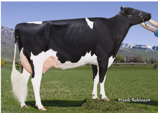
T-C-G SHOTTLE MINNOW FOURTH DAM