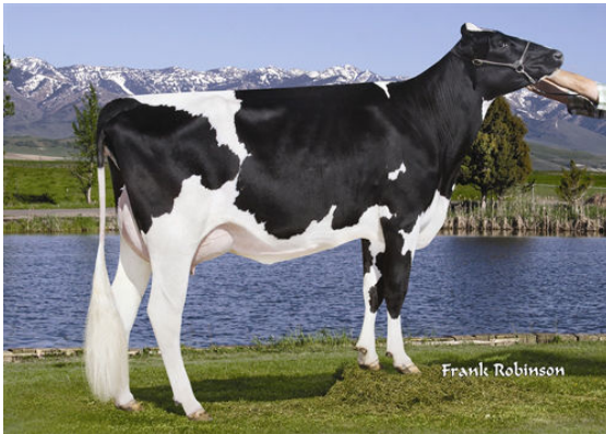
T-C-G OBSERVER MAY THIRD DAM