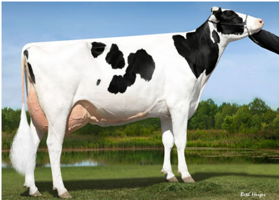
SEAGULL-BAY MOGUL 1725 GRANDDAM