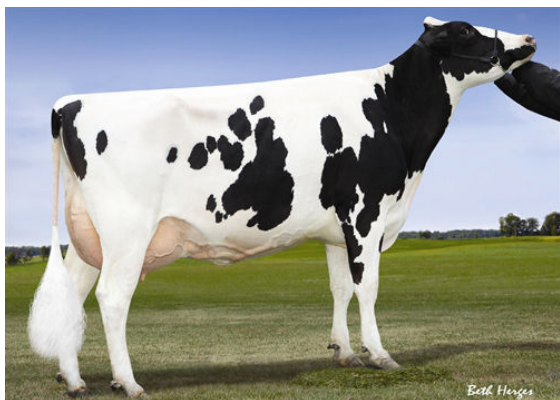
LADYS-MANOR PL SHAKIRA