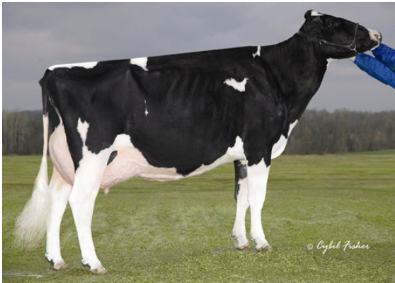
BUDJON-JK DUR ESQUISITE FIFTH DAM