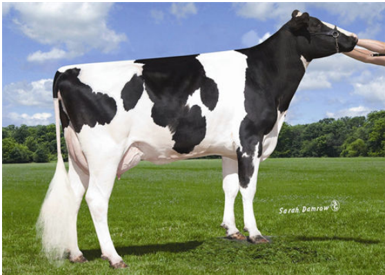
BLUE-HORIZON PLAN EDITH THIRD DAM