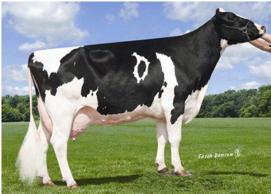
ROLLING-SPRING M ECLIPSE FOURTH DAM