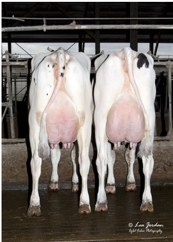
MASTERFUL DAUGHTER GROUP