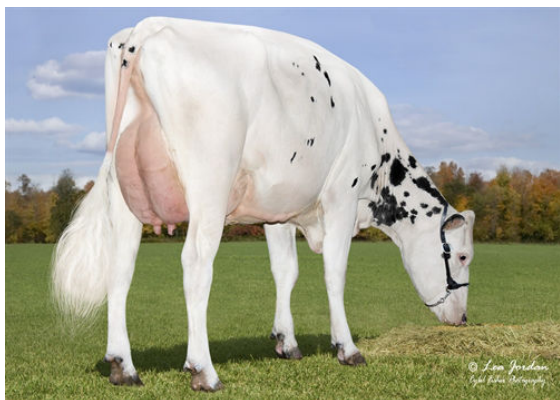
BLASER MASTERFUL 5502