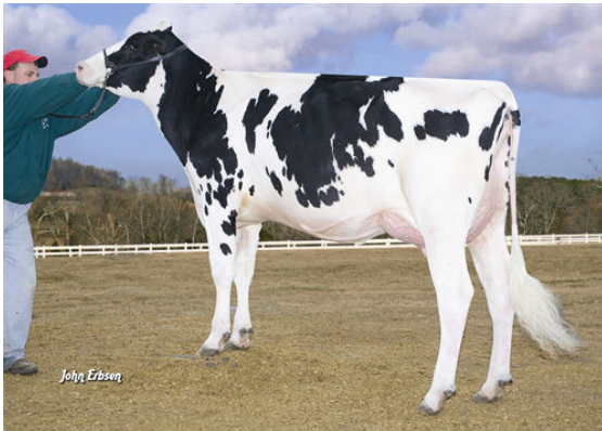
WABASH-WAY BOL ELIZABETH Dam