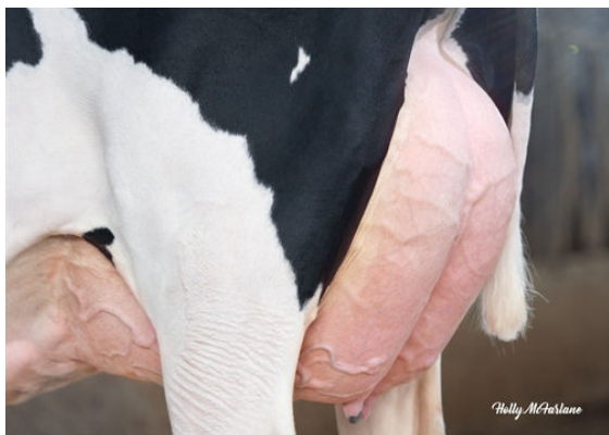
PROGENESIS ZAZZLE PAPRIKA DAM