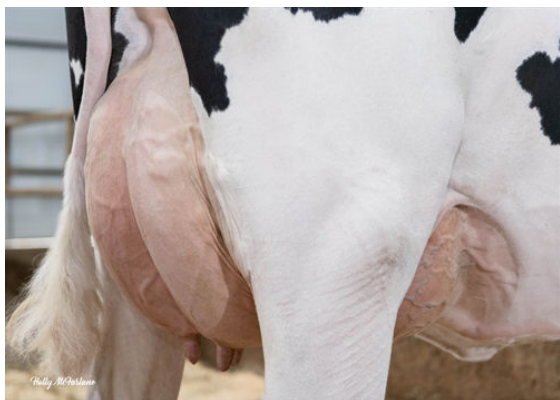
PROGENESIS CABOT MAYER DAM