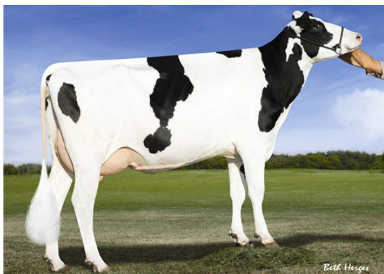
SANDY-VALLEY ROBUST RUBY