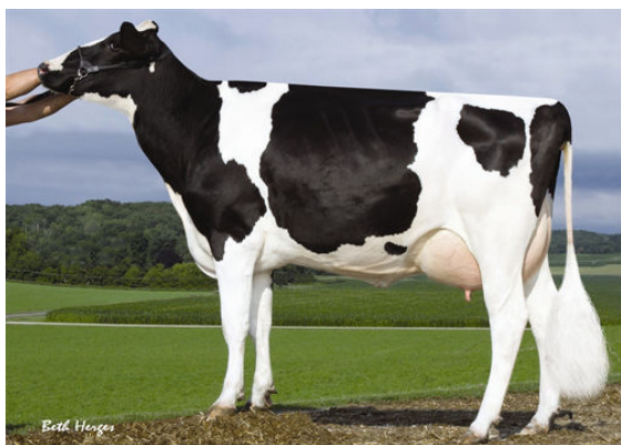
SANDY-VALLEY PLANE SAPPHIRE