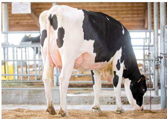
WINSTAR CLARITY 5610