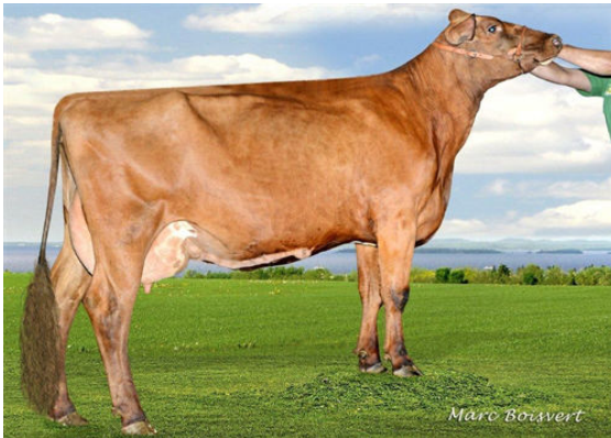
MARDEL OBLIQUE MIA-MI 28 DAM