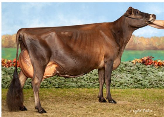
BRI-LIN VALSON SPRITZ DAM