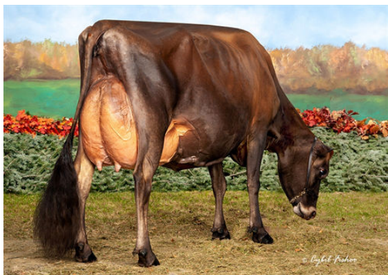
BRI-LIN VALSON SPRITZ DAM