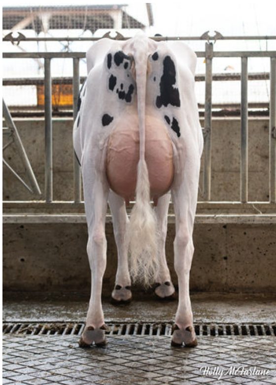
PROGENESIS HIGHJUMP POPCORN GRANDDAM