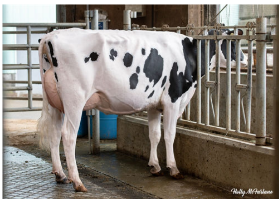
PROGENESIS HIGHJUMP POPCORN GRANDDAM